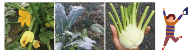
季節により、販売内容が異なります。

町内では、ズッキーニやフェンネルなどのイタリア野菜の栽培も行われています。栽培された野菜は、ひらお特産品センターで販売しています。