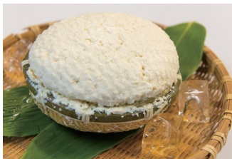
自家製豆腐【福助トーフ店】