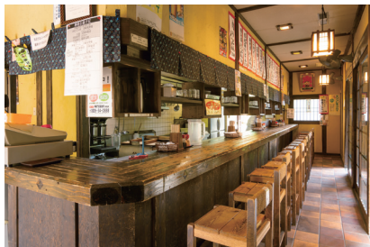
うどん・そば 【権兵衛】

一番人気の「夜又うどん」は、唐辛子の効いた、うま辛の特製スープに豚肉を乗せ特産の青ネギがたっぷり乗った逸品です。ぜひ、ご賞味ください。