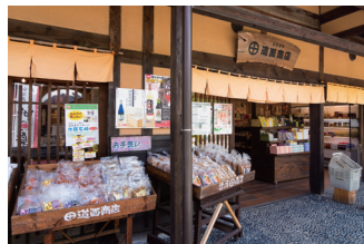
おみやげ処【道面商店】