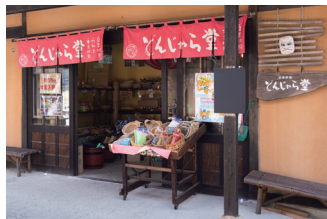
おもちゃ【どんじゃら堂】