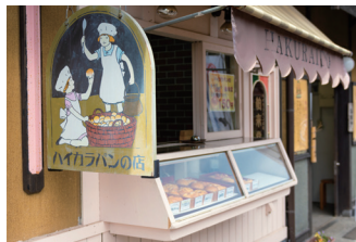
ハイカラバンの店【舶来堂】