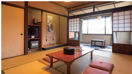
【山や】【里や】 【やまや別館】