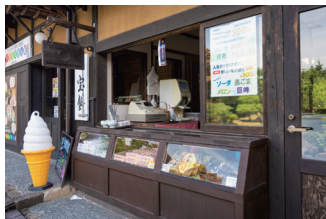
もち・和菓子【宝餅】