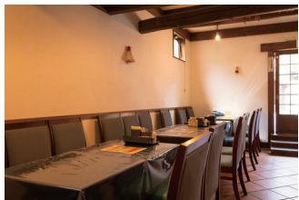
軽食・喫茶 【キッチン蔵】