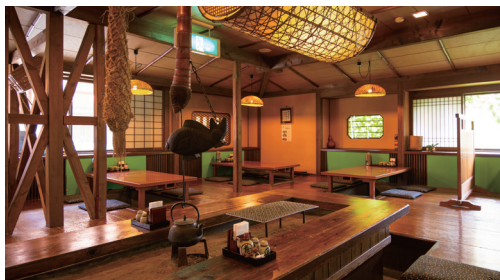
お食事処 【ふくすけ】

神楽門前湯治村には、「お食事処 ふくすけ」をはじめ、様々なお店が通りに軒を連ねています。 地元の新鮮な野菜や自家製豆腐を使った料理など山里の美味・珍味をお気軽にお楽しみいただけます。