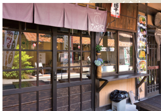
団子・甘党 【ひなや】