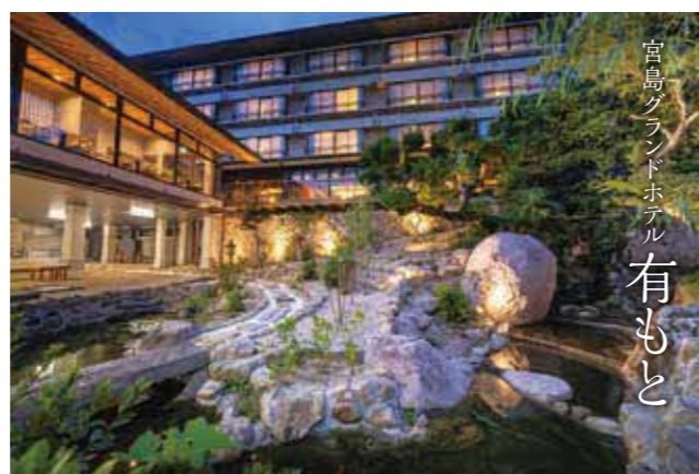
宮島グランドホテル 有もと

営 チェックイン 15:00~ チェックアウト 10:00 所 廿日市市宮島町もみじ谷 ☎ 0829-44-2233