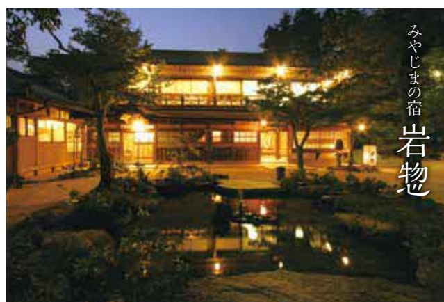
みやじまの宿 岩物