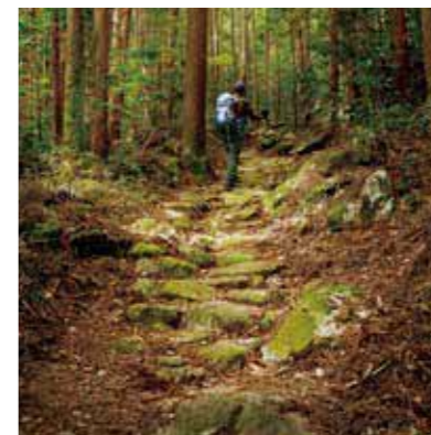
苔むした石だたみ道

所 廿日市市津田3322-1 約2mの花崗岩が二つ重なった珍しい岩。「落ちない」神社として受験生がお参りに来る人気のパワースポット。