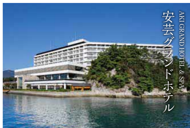
AKI GRAND HOTEL & SPA 安芸グランドホテル