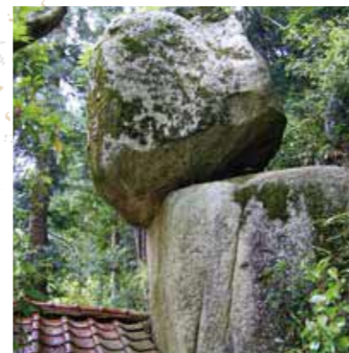
「落ちない」観光名所