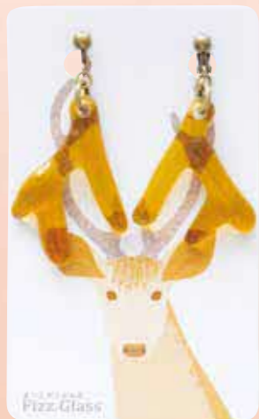
宮島のきらめきを ちりばめたようなガラス細工