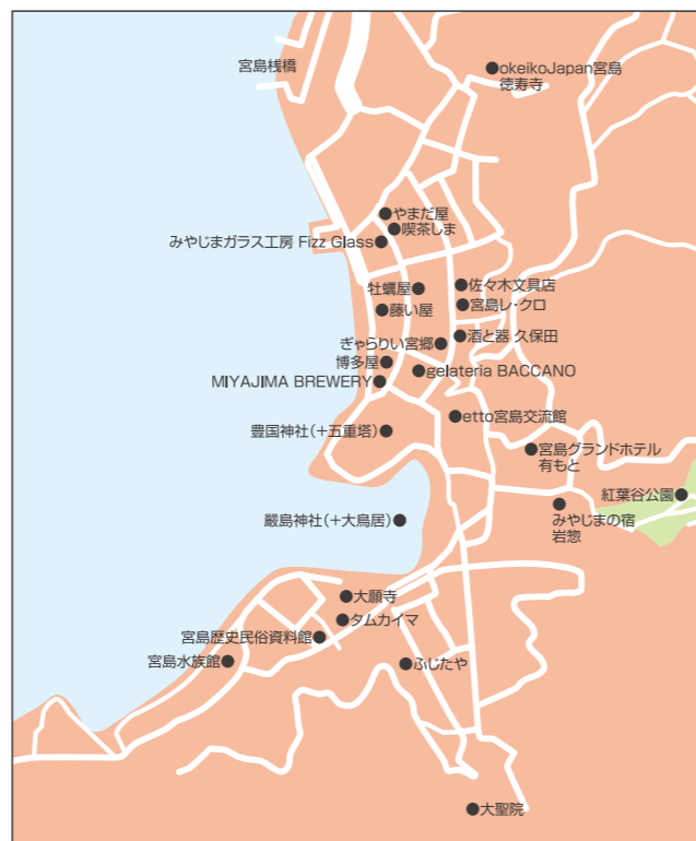
宮島エリア拡大マップ