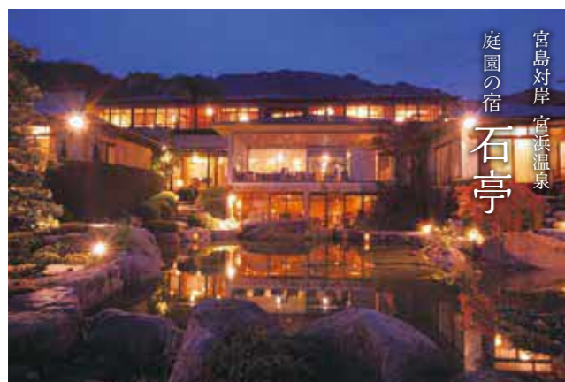
宮島対岸 宮浜温泉 庭園の宿 石亭

営 チェックイン 15:00~ チェックアウト 10:00 所 廿日市市宮島町364 ☎ 0829-44-2411