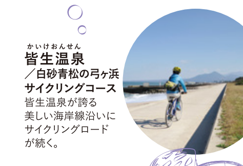
皆生温泉 / 白砂青松の弓ヶ浜サイクリングコース 皆生温泉が誇る美しい海岸線に沿ってサイクリングロードが続く。