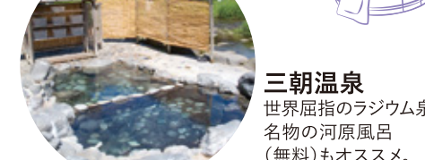
三朝温泉 世界屈指のラジウム泉。名物の河風風呂(無料)もオススメ。