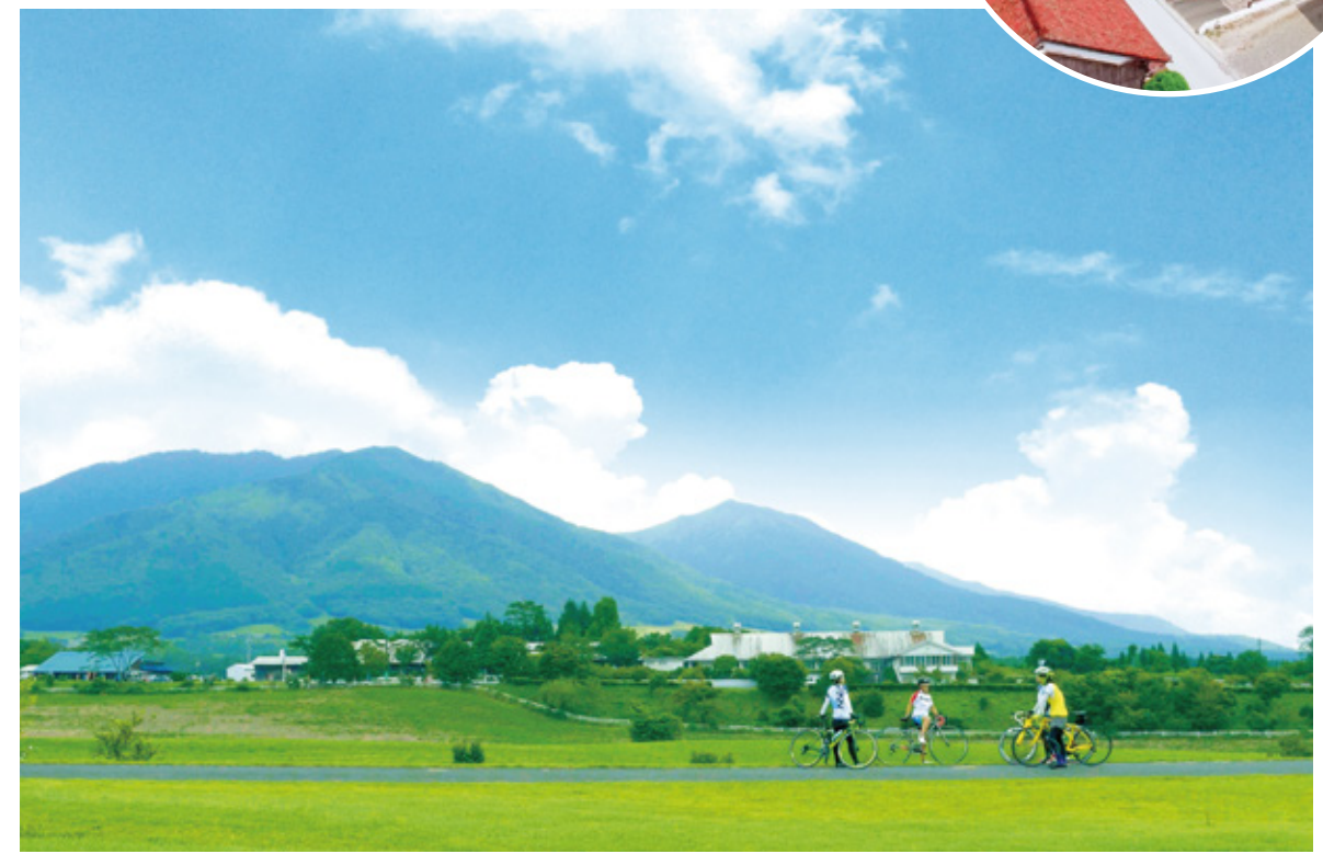
国立公園 蒜山 / 蒜山高原自転車道ルート 雄大な景色と自然に恵まれた西日本屈指の高原リゾート地です。