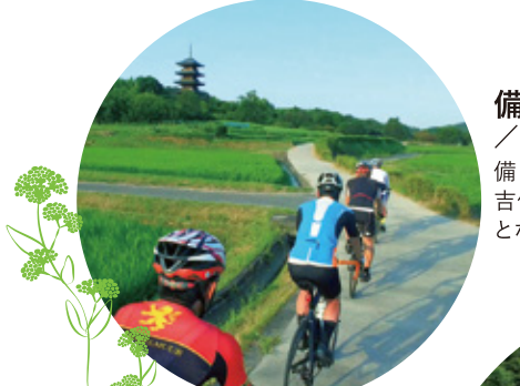
備中国分寺周回 / 吉備路自転車道ルート 備中国分寺の五重塔は、吉備路を代表するシンボルとなっています。

吹屋ふるさと村 / 奥吉備やまびこルート 2020年6月に日本産産に登録。赤銅色の石瓦とベンガラ色の外観で統一された町並みが続きます。