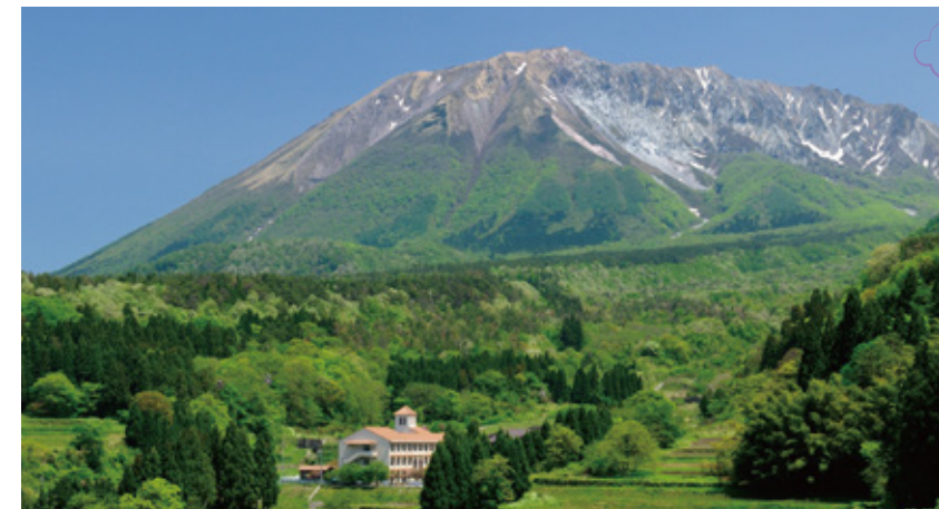
大山 西日本最大級のブナの原生林が広がる。ブナのトンネルを走れば気分爽快！