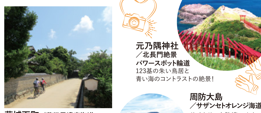
萩城下町 / 萩世界遺産海道 明治維新の中心となった歴史の町をのんびりボタリング！

元乃隅神社 / 北長門絶景パワースポット輪道 123名の美しい鳥居と青い海のコントラストの絶景！