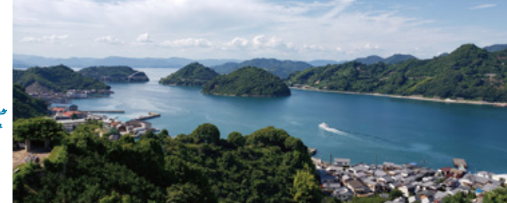
安芸灘とびしま海道 7つの島々を橋で繋いだ海道。瀬戸内の多島美と海が織りなす景色を楽しむことができます。