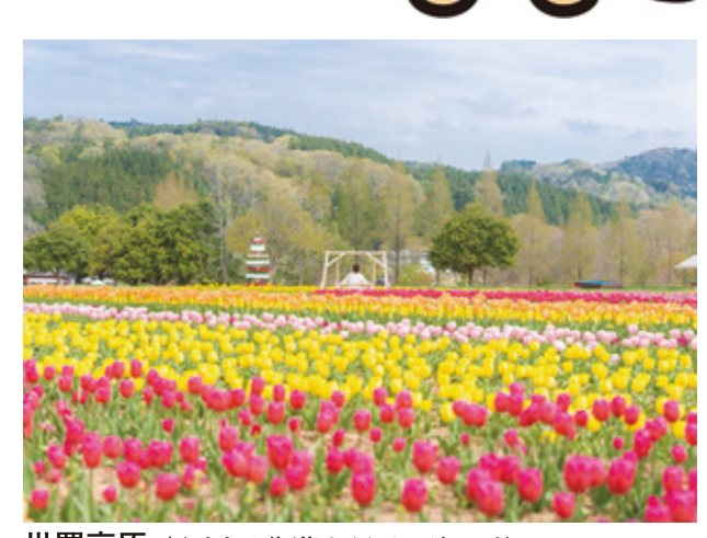
世羅高原 / やまなみ街道サイクリングロード 四季折々の絶景を創り出す。国内最大級の花農園。チューリップ、ひまわり、ダリア等季節ごとに楽しめます。

三段峡 / やまがたロングサイクルコース 特別な勝にも指定された西日本有数の大峽谷。カヤックやSUPなども人気で、大自然を満喫できるアクティビティも充実。