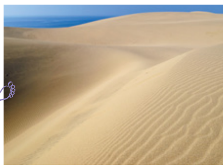
鳥取砂丘 鳥取県が誇る日本一のスナバ。探足で歩くのがオススメ。